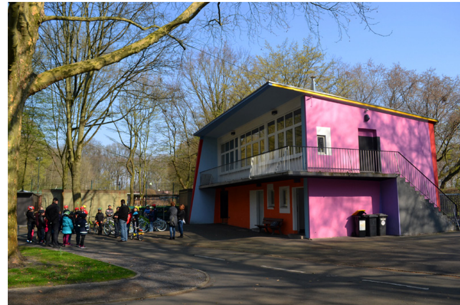
Das Training findet im Fredenbaumpark bei der Jugendverkehrsschule statt (neben dem Abenteuerspielplatz am „Big Tipi“).

Bei ihr erfahren Sie die Termine. Diese sind aber auch dem beiliegenden Blatt zu entnehmen.