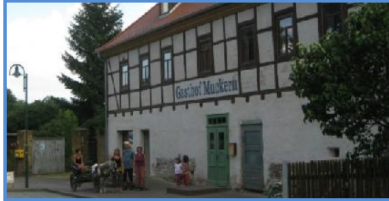
Mittagessen im Café Muckern

unterstützt von Scholz Recycling Espenhein