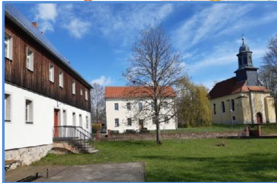
Kaffeetrinken in Mölbis mit dem Förderverein Marienkirche Mölbis e.V. (Kirche z. Z. geschlossen) – es spielt der Posaunenchor Kitzscher