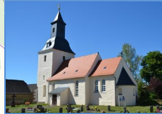
Andacht und Abendsingen mit Volksliedern zu musikalischer Begleitung mit dem Förderverein Magdalenenkirche e.V.