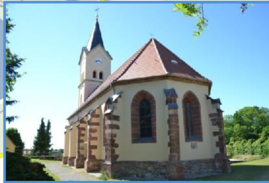
Orgelmatinee in Großpötschau an der sanierten Poppe-Organ der Auferstehungskirche