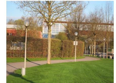
Sport- und Freizeitpark in Gröbenzell

Gröbenzell: Ascherbachstraße kleine Bahnunterführung (Achtung! nur Fußweg) → Ascherbachstraße → Sonnenweg (geradeaus) → Brücke beim S-Bahnhof Gröbenzell (geradeaus) → Gröbenbachstraße (in der Linkskurve beim Wertstoffhof rechts) → Fuß-/Radweg entlang der Bahn (am Ende links) → von-Koch-Straße (erster Abzweig rechts in den Bürgerpark) → im Bürgerpark vor dem See rechts vorbei