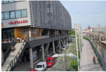
Hackerbrücke wird neben dem ZOB auf einem Radweg kreuzungsfrei unterquert.

Hirschgarten: Radweg neben der Bahn (geradeaus) → Radweg-Unterführung Friedenheimer Brücke neben der S-Bahnstation Hirschgarten → Radweg durch den Grünbereich Richelstraße (geradeaus und Rechts-/Linksbogen am Ende rechts) → Richelstraße (Linksbogen entlang der S-Bahnstation Donnersberger Brücke) → neben Tengelman in die Erika-Mann-Straße über eine asphaltierte Furt → Erika-Mann-Straße (am Ende geradeaus) → Bernhard-Wicki-Straße (am Wendehammer rechts) → auf Radweg links unter der Hackerbrücke parallel zur Bahn am ZOB, am Radwegende rechts → Arnulfstraße (geradeaus) → München-HBF