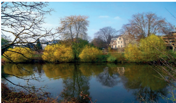
Am Staden in Saarbrücken

Egal, ob Sie neu in der Stadt sind oder schon länger hier wohnen: Der ADFC Saar zeigt Ihnen mit Unterstützung der Landeshauptstadt Saarbrücken, wo und wie man sich mit dem Rad gut in der Stadt bewegen kann. Dabei kommen wir an Stellen und Orten vorbei, die Sie bisher bestimmt noch nicht gesehen haben. Wir durchqueren die Stadtteile und zeigen Ihnen, wie Sie auf verkehrsarmen, sicheren und komfortablen Wegen in die City kommen.