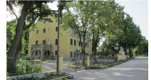
Historische Gebäude in Freiham

Gräfelfing: Freihamer Straße (am Ende links) → Bahnhofsstraße (Bahnunterführung passieren und danach im Kreisel geradeaus, 3. Straße rechts) → Rottenbacher Straße (2. Straße links) → Zugspitzstraße (Stefanusstraße überqueren) → auf Fuß-/Radweg (Würmbrücke und Pasinger Straße überqueren) →