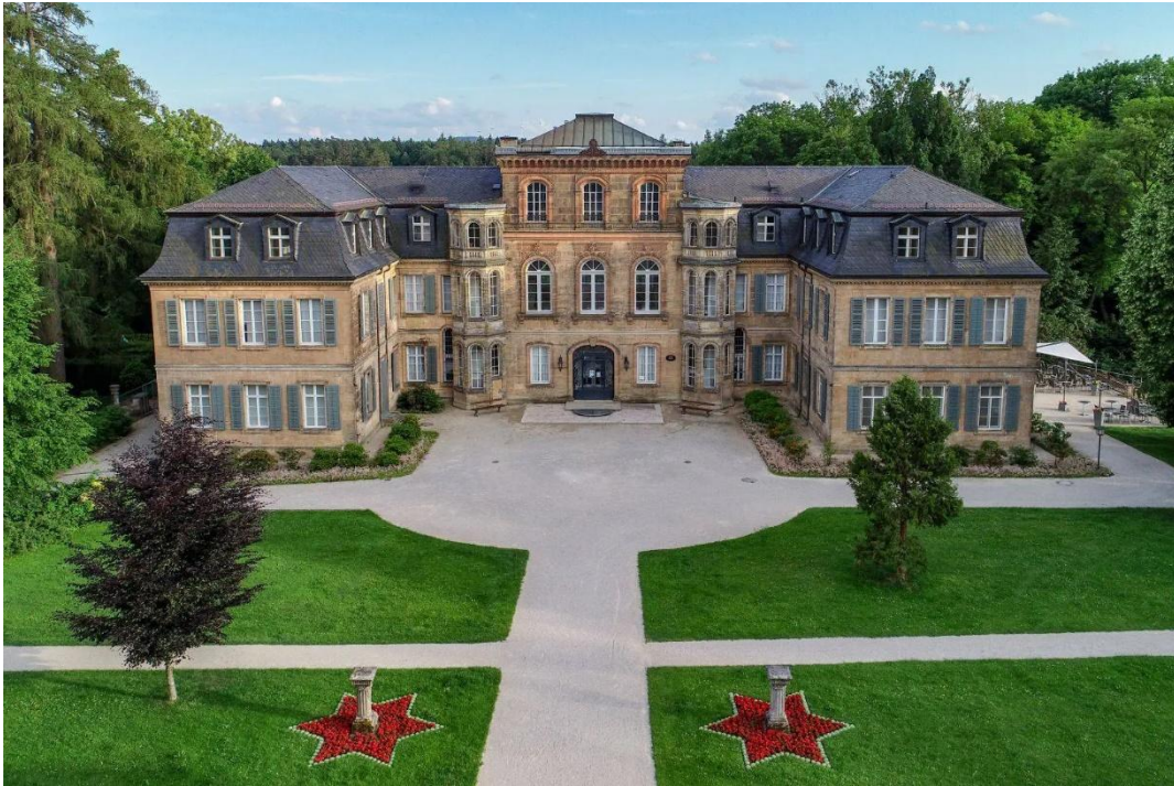
Fantasie in Donndorf bei Bayreuth