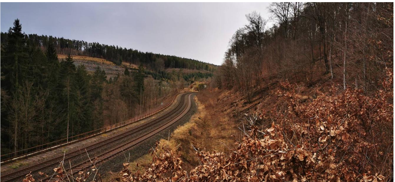
Schiefe Ebene (Eisenbahnsteilstrecke zwischen Franken und Böhmen)