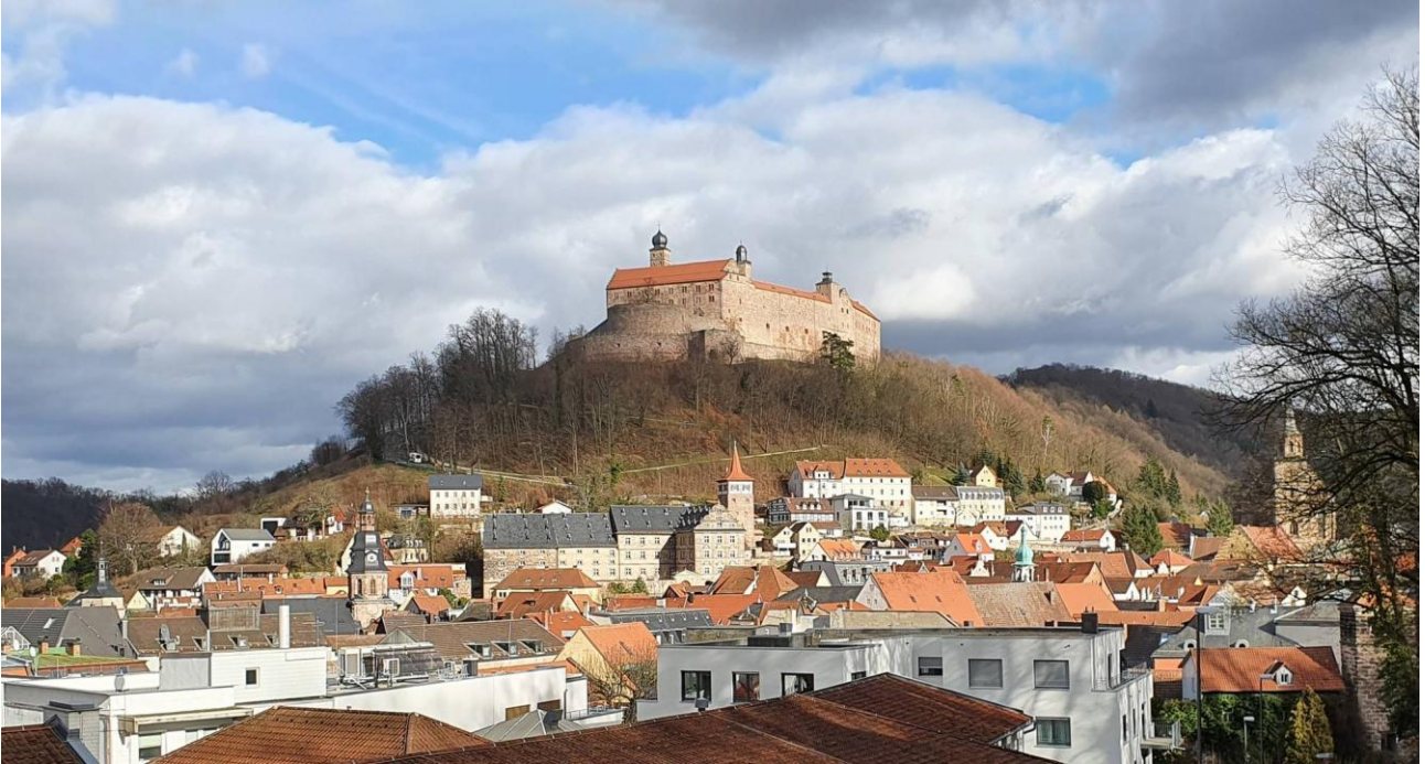
Plassenburg über Kulmbach