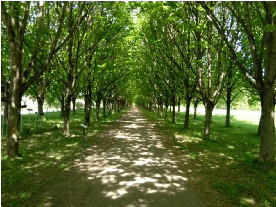
Baille-Maille-Lindenallee in Himmelkron (Ballspiel)