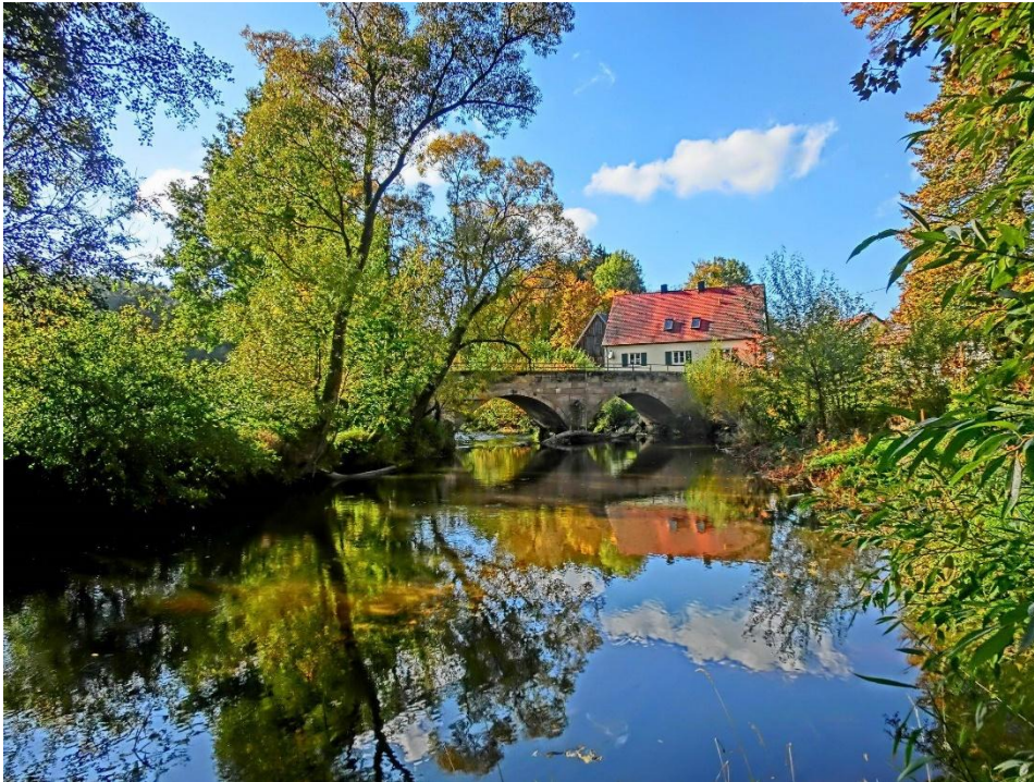
Über den Weißen Main