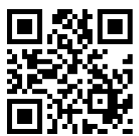
Kinder aufs Rad